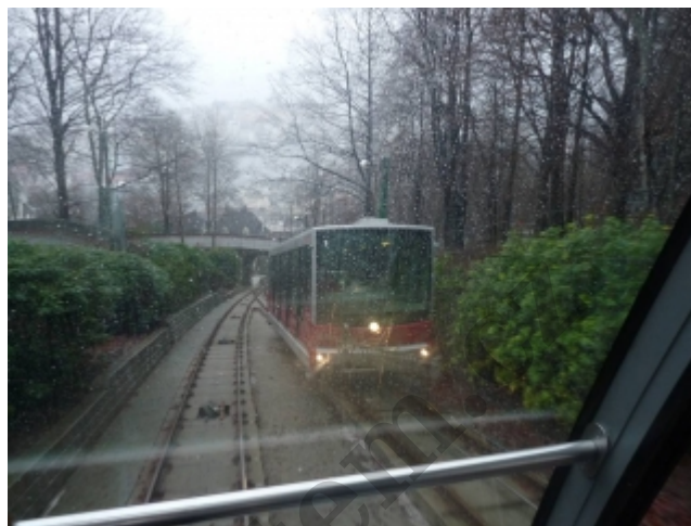
Fløibanen, pohled z kabiny při potkávání

Na takhle triviální procházku se vážně člověk nemusí moc připravovat. Vždyť tam vede i silnice s pouličními lampami po stranách! Takže šupito, šetříme, jde se pěšky. Vystupujeme z Bybanenu ve stanici Byparken (konečná v centru). Jdeme přes náměstí směrem do Bryggen, ale nestáčíme se doleva, stejně jako hlavní silniční tah, ale pokračujeme rovně, do kopce. Počáteční stanici Fløibanenu pohrdlivě míváme, protože takovouhle procházku zvládneme po svých. Mimochodem, nečekejte, že z venka v počáteční stanici uvidíte nějaký vláček, protože první úsek se jede tunelem ve skále. Ve skutečnosti jsme málem nepoznali, že odsud fakt Fløibanen vyráží.